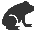
Leefgebied Natte Dooradering