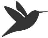
Leefgebied Open Grasland weidevogelbeheer

De belangrijkste taak van het collectief is het uitvoeren van Agrarisch Natuur- en Landschapsbeheer (ANLb). In totaal zetten 185 boeren zich in voor het agrarisch natuurbeheer. Wij doen dat binnen 3 leefgebieden: