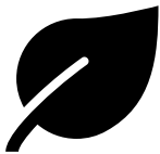
Leefgebied Open Grasland

De belangrijkste taak van het collectief is het uitvoeren van Agrarisch Natuur- en Landschapsbeheer (ANLb). In totaal zetten 186 boeren zich in 2022 in voor het agrarisch natuurbeheer, met als belangrijkste doel de populatie van weidevogels. Wij deden dat binnen 3 leefgebieden: Open Grasland, Natte Dooradering en Waterkwaliteit. Per 2023 komt leefgebied Klimaat erbij.