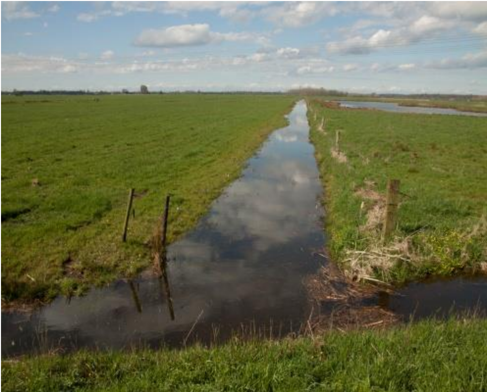
Hoog waterpeil in sloot remt de grasgroei in aangrenzend perceel

Door het slootpeil tijdelijk op te zetten ontstaat een plek waar het bodemleven goed beschikbaar is voor weidevogels. Ook vertraagt de grasgroei en wordt de structuur van de grasmat wat opener. Een hoog waterpeil werkt extra goed als het gelegen is naast kruidenrijk grasland, waar de weidevogels kunnen schuilen en als foerageergebied werkt voor de jonge vogels. De periode van hoog waterpeil is afgestemd op het weidevogelseizoen.