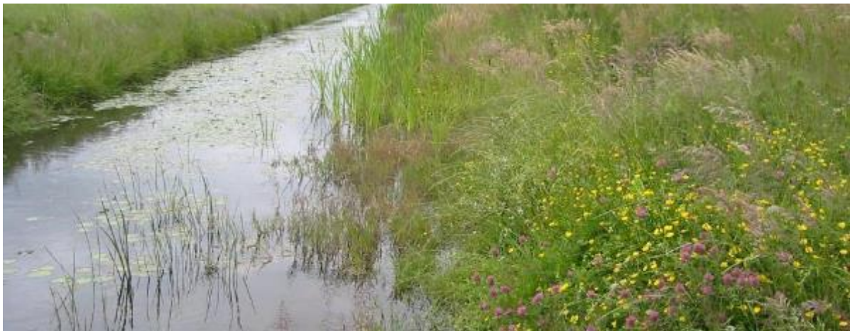
Natuurvriendelijke oever

Natuurvriendelijke oevers beschermen tegen afkalven van de oever. Door, bijvoorbeeld, drinkbakken te plaatsen, voorkom je vertrapping van de oever door vee. Dat helpt om te voorkomen dat veen 'weglekt' naar de sloot en wordt extra slibvorming voorkomen. Slib in veensloten is een belangrijke bron van methaanuitstoot. Natuurvriendelijke oevers dragen daardoor bij aan klimaatmitigatie omdat slibvorming en daarmee methaanuitstoot voorkomen wordt.