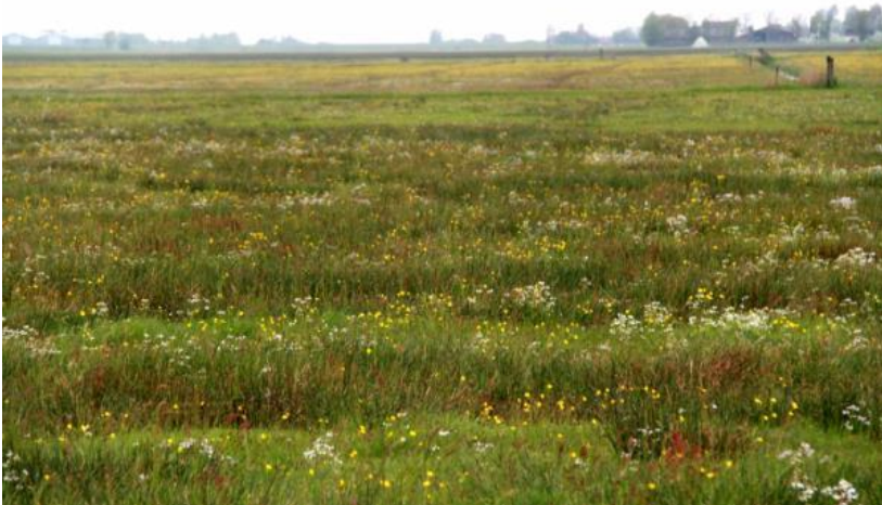
Kruidenrijk grasland

Op kruidenrijke graslanden komen de kruiden van nature in grotere aantallen voor en zijn verspreid over het hele perceel. De zode is open en divers van structuur door de vele kruiden met veel bloei-stengels en weinig blad. Dit heeft ook als voordeel dat kuikens zich goed kunnen voortbewegen in het grasland.