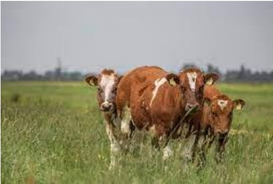
Beweiding met koeien levert meer variatie in structuur dan beweiding met schapen

Dit pakket werkt het best met een veebezetting van 1,5 GVE/ha. Beweiden met 3 GVE/ha is in samenhang binnen het weidevogelmozaïek waardevol. Dit geldt met name als er beweid wordt in plaats van gemaaid in de randzones van een mozaïek. Er wordt gewerkt met een lage veebezetting, zodat er voldoende ruimte voor weidevogels is. Dit pakket past bij een grasproductie van ca. 7 ton droge stof/hectare/jaar. De pakketvarianten onderscheiden zich door de periode van extensief beweiden en de veebezetting.