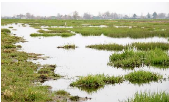
Plas dras in Krimpenerwaard

Het pakket met startdatum 15 februari heeft als voordeel dat de plasdras aanwezig is bij de start van het weidevogelseizoen, het pakket met startdatum 1 maart biedt een langere tijd voor de ontwikkeling van de bodemfauna. De plasdrassen in de periode mei-augustus hebben een functie als opvethabitat voor de vogels. De plasdras in november-december is bedoeld voor overwinterende soorten zoals de Kleine zwaan.