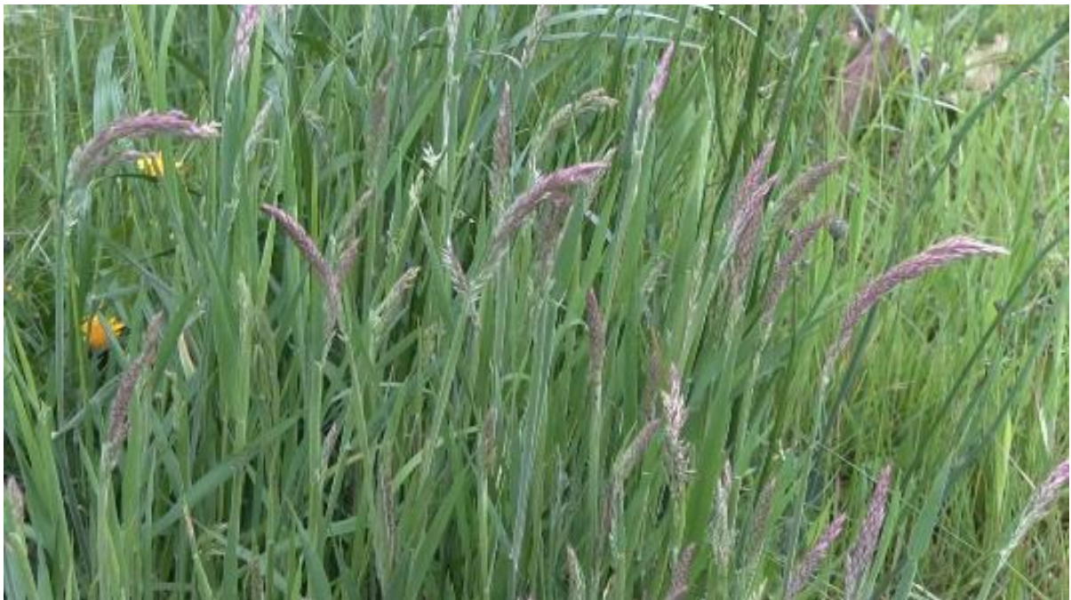
Witbol domineert hier de vegetatie, terugdringen door tweede helft mei te maaien

Dit pakket is bedoeld voor percelen waar je (extensief) kruidenrijk grasland wilt ontwikkelen, maar die nu nog zeer soortenarm zijn. Deze percelen worden bijvoorbeeld gedomineerd door witbol of bestaan nog geheel uit Engels raaigras. Verschralen van de bodem bevordert de kruidenrijkdom, dat wil zeggen dat er niet wordt bemest, er geen bagger wordt opgebracht en het maaisel wordt afgevoerd. Ook door beweiding achterwege te laten, voorkom je bemesting van het perceel en zorg je voor een snellere verschraling van het perceel. Vroeg maaien is van belang om het dominantiestadium van witbol te doorbreken, dan wel om zoveel mogelijk voedingsstoffen af te voeren. Omdat de eerste snede in het broedseizoen is, zal er naar nesten gezocht moeten worden.