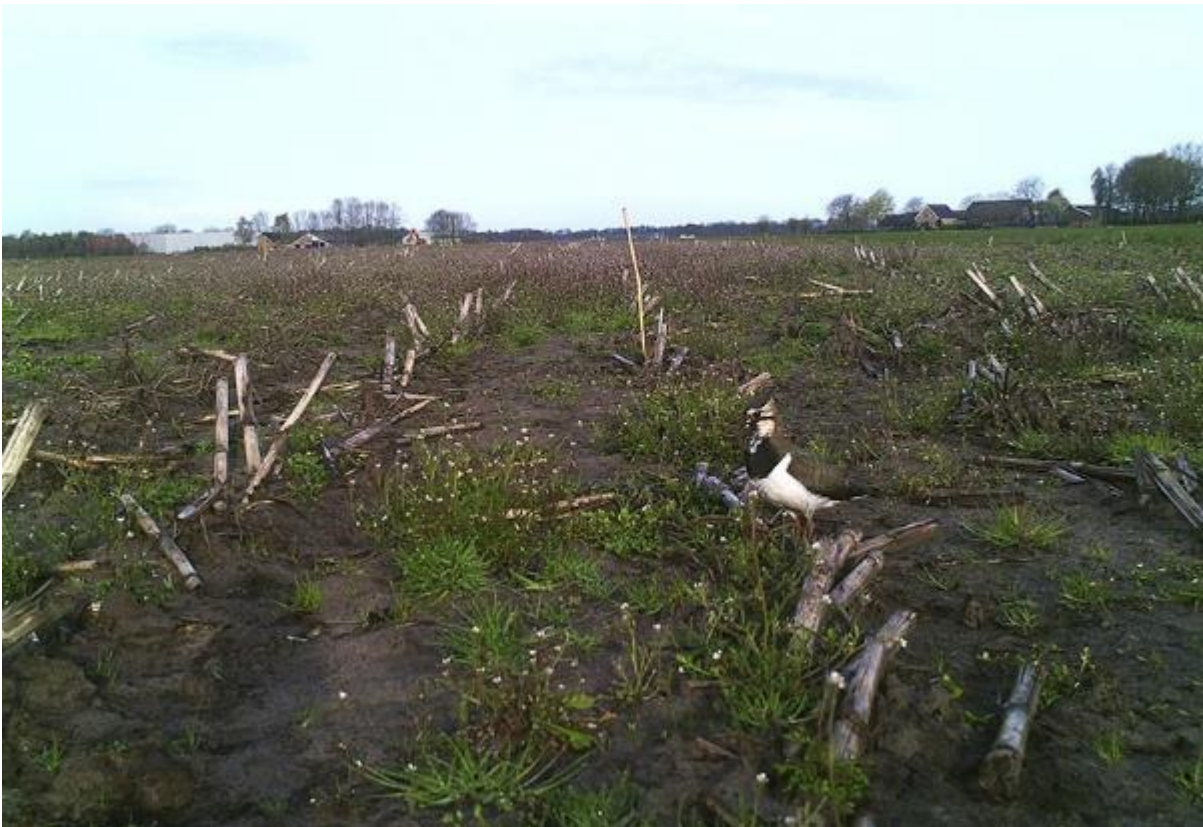
Kievit op bouwland met uitgesteld zaaien, fragment

Contact met veldmedewerkers en/of vrijwilligers is erg belangrijk. Zij brengen de nesten en kuikens in kaart, waarbij zoveel mogelijk vanaf de rand van het perceel gemonitord wordt. Nesten worden geregistreerd, het liefst digitaal. Nesten worden beschermd tegen verstoring via verplaatsen, nestbeschermers of via uitstellen van zaaien van het gewas.