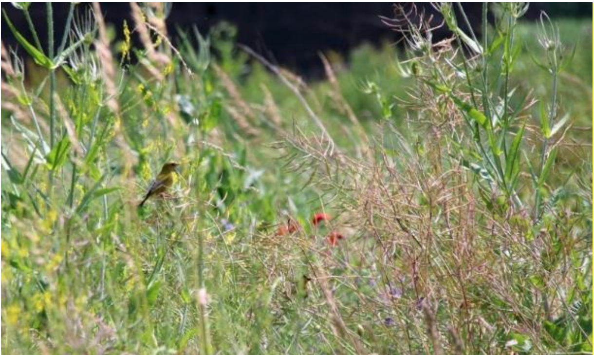
Bloemenblok in de zomer

Daarnaast is er volop zaad te vinden in de herfst en winter én bladgroen aan het einde van de winter als de zaden op raken. Bovendien biedt de begroeiing dekking tegen predatoren en slechte weersomstandigheden. Naast patrijzen zijn er nog vele andere vogelsoorten die van een bloemenblok kunnen profiteren. Ook vlinders, bijen en hommels profiteren van het grote aanbod van bloemen.