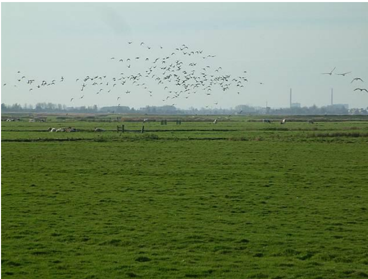
Weidevogellandschap ( https://nl.wikipedia.org/wiki/Weidevogel )

Voor kieviten zijn een aantal pakketten met een vroegere rustperiode geschikt (vanaf 15 maart), de rustperiode loopt voor kieviten ook eerder af, uiteraard alleen als er geen opgroeiende kuikens, ook niet van andere soorten, aanwezig zijn.